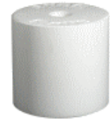
Handelsüblicher mineralgepresster Leckstein

Würden Sie handelsübliche mineralgepresste Lecksteine auch für die heimische Küche verwenden? Ich glaube nicht.